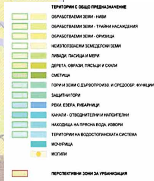
Легенда Районна устройствена схема